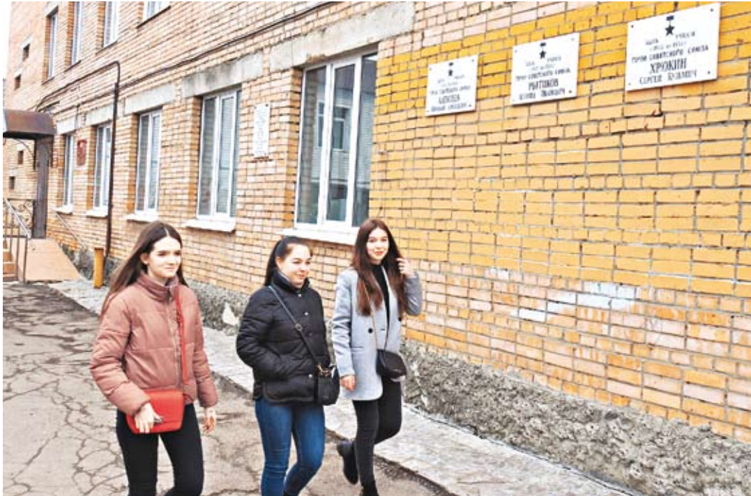
На стене колледжа скоро должна появиться четвертая мемориальная доска советским героям