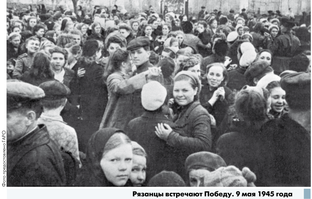
Рязанцы встречают Победу. 9 мая 1945 года

Наряду с Рязанью почетного звания «Город трудовой доблести» добиваются еще несколько городов страны, среди них – Челябинск, Нижний Новгород, Магнитогорск, Иваново. Звание присваивается Указом Президента России. Сбор подписей среди рязанцев и жителей области продолжается.