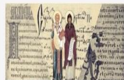
Кирилл и Мефодий - славянские просветители