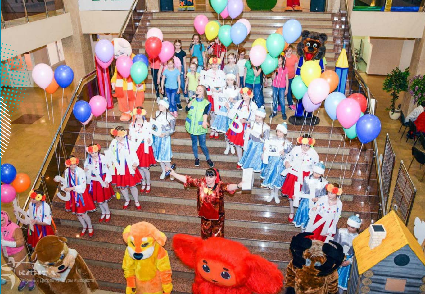
КОНФА Районный Дом культуры и искусства